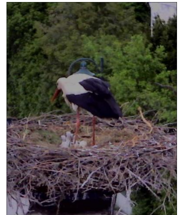
19.05. Sind es 4 od. 5 Junge?