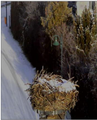
13. 01. Schnee im Nest