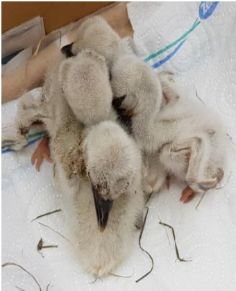
22.06. Die 4 Babys auf den Weg nach Rust.