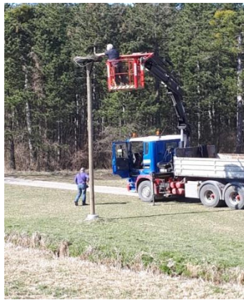
27.03. Nestpflege am Stadtweg