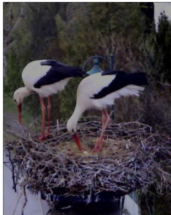
14.04. Das 1. Ei