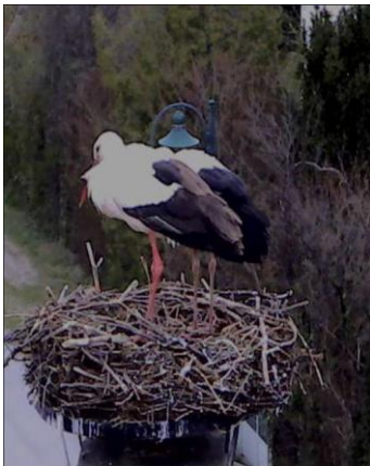
05.04. Wieder vereint