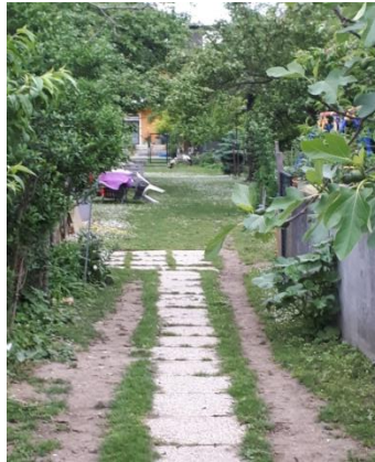
22.06. Die Aufzuchtstation In Rust.