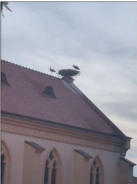
18.07. Das leere Nest wird begutachtet.