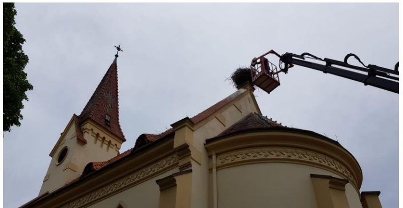
22.05. Rettung der 4 Storchenbabys