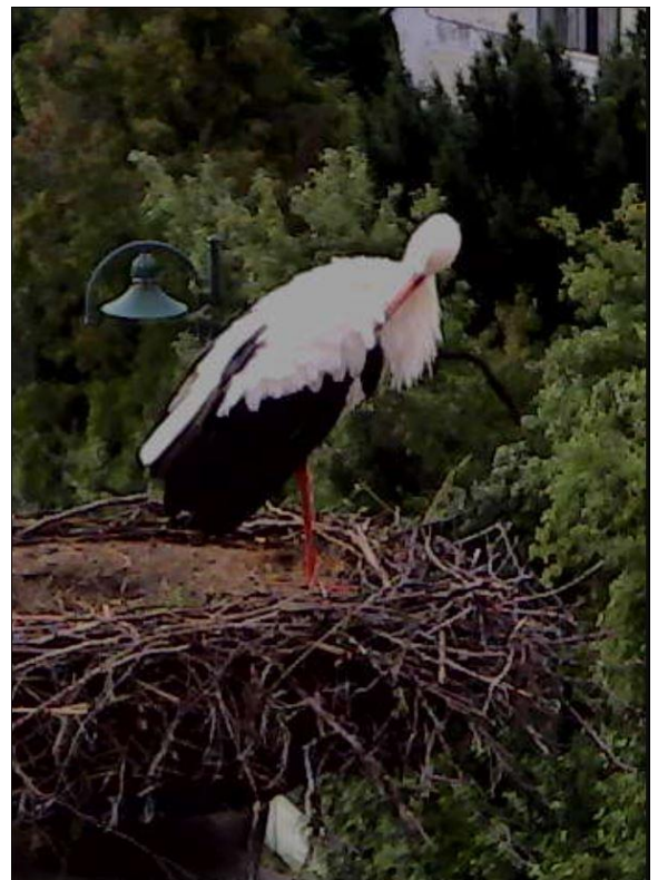
26.08. Unser Storch ist wieder Da!